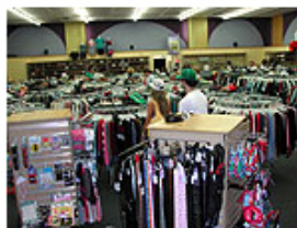
▲女性服は60%、男性服は40%の割合